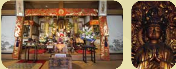
本堂・御本尊:十一面千手千眼観世音菩薩

戦後、柳谷観音「楊谷寺」より「十一面千手千眼観世音菩薩」を拝領し、本尊として安置し奉り、柳谷観音大阪別院として再出発、信仰道場として現在に至る。